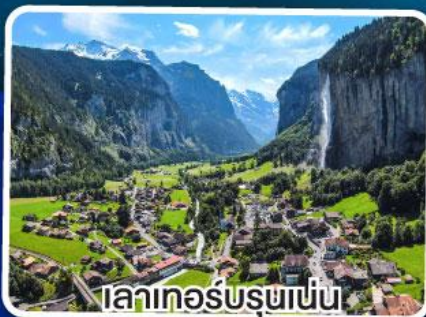
เลาเทอร์บูรนาเบิน