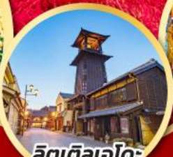
ลิตเติลเอโดะ เมืองคาวาโกเอะ