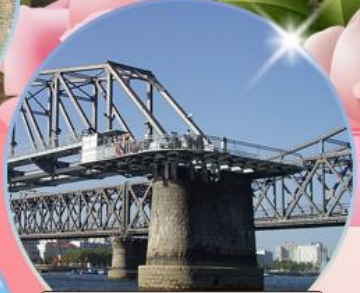
สะพานขาดตานตง