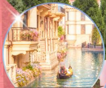
เวนิส เมืองต้าเหลียน