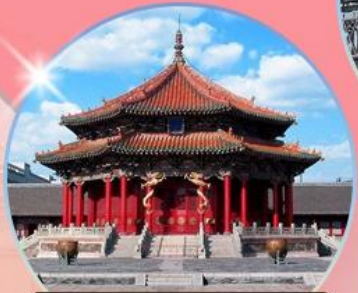
พระราชวังกู้กง เลิ่นหยาง