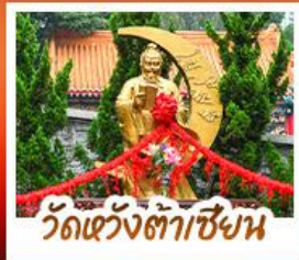
วัดเซว้งต้าเซียน

ขอพรเซงครบทั้ง 3 องค์ เรื่องโชคลาภ การเงินและธุรกิจ • มังกรเซงฮ้างปิง ลักการะพระใหญ่เทียนถาน • เจ้าแม่กวนอิมฮ่องฮ่า ขอเรื่องเงิน ทรัพย์สิน ความมั่งคั่งเจ้าแม่กวนอิมทะเล ขอพรเรื่องความสำเร็จ จดเปิดเป่าสิ่งไม่ดี พิธีโรงเมง 4 ดาว แหล่งฮ้อปิง...ย่านจิมซาจุ่ยหรือฮ่าแมงกิก