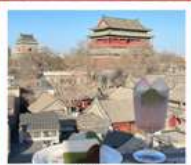
คาเฟ่ น้ำตาล