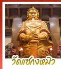
วัดเขกงเมิว