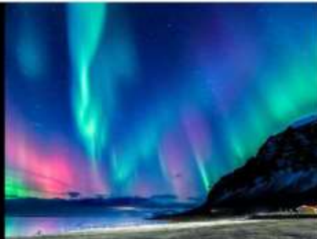
***รูปภาพเพื่อประกอบการโฆษณาเท่านั้น***