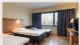
Triple สำหรับ 3 ท่าน