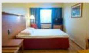
Double สำหรับ 2 ท่าน