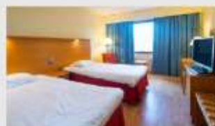
Twin สำหรับ 2 ท่าน