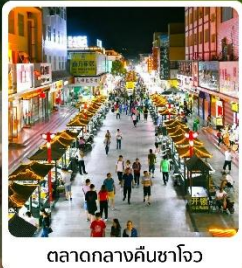
ตลาดกลางคืบซาโจว