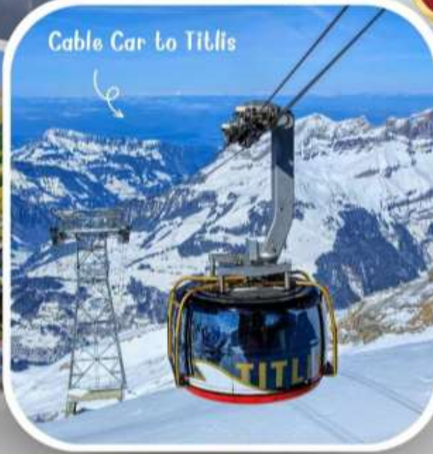
Cable Car to Titlis