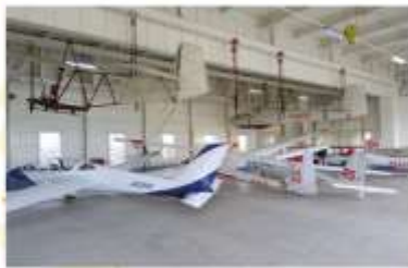
TAKIKAWA SKY PARK MUSEUM