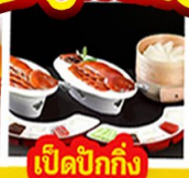
เปิดปีกกึ่ง