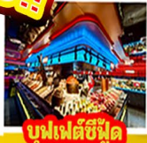
บุฟเฟต์ซีฟู้ด