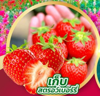
เก็บ สตอร์วเบอร์รี่