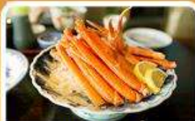
พิเศษ! ชาบู