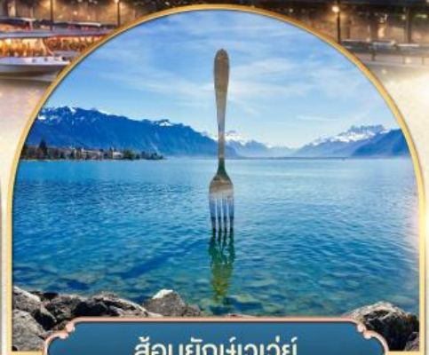
ล้อมยึกเขาวัว