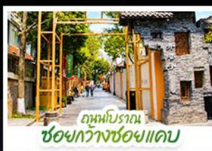
ถนนโบราณ ซอยกว้างซอยแคบ