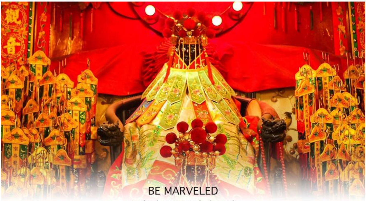
BE MARVELED วัดเจ้าแม่กวนอิมฮองอำ (ยืมเงิน)

จากนั้นนำท่านสู่ เจ้าแม่กวนอิม วัดสองอำ (HUNG HOM KWUN YUM TEMPLE) เป็นหนึ่งในวัดที่เก่าแก่ที่สุดของฮ่องกง และชาวฮ่องกงเลื่อมใสกันมาก สร้างขึ้นในปี ค.ศ.1873 ในสมัยช่วงสงครามโลกครั้งที่ 2 มีการปล่อยระเบิดลงบริเวณใกล้กับวัดแห่งนี้หลายต่อหลายครั้ง ทำให้มีผู้บาดเจ็บและล้มตายเป็นจำนวนมาก แต่ชาวบ้านที่หนีเข้าไปหลบภัยในวัดนี้กลับปลอดภัยอย่างปาฏิหาริย์ และตัววัดก็ไม่ได้รับความเสียหายจากเหตุการณ์ทิ้งระเบิดที่น่าอัศจรรย์ ตามความเชื่อของคนจีนในฮ่องกง-มาเก๊า จะมี "วันเปิดทรัพย์" หรือ "พิธียืมเงิน เจ้าแม่กวนอิมฮ่องกง" เป็นวันที่จะมาขอพรและยืมเงินเจ้าแม่กวนอิม ซึ่งนับจากหลังวันตรุษจีน ไป 26 วัน จะเป็นวันเปิดทรัพย์ที่จัดขึ้นในทุกๆปี พิธีนี้จะมีเพียงครั้งปีละครั้งเท่านั้น เป็นวันสำคัญอีกวันที่คนหลังไหลมาไหว้ขอพรอย่างไม่ขาดสาย