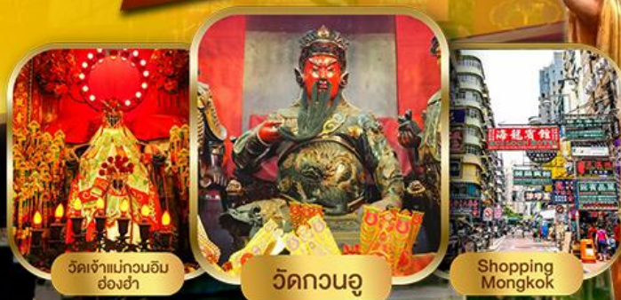
วัดเจ้าแม่กวนอิม ฮองเฮ่า