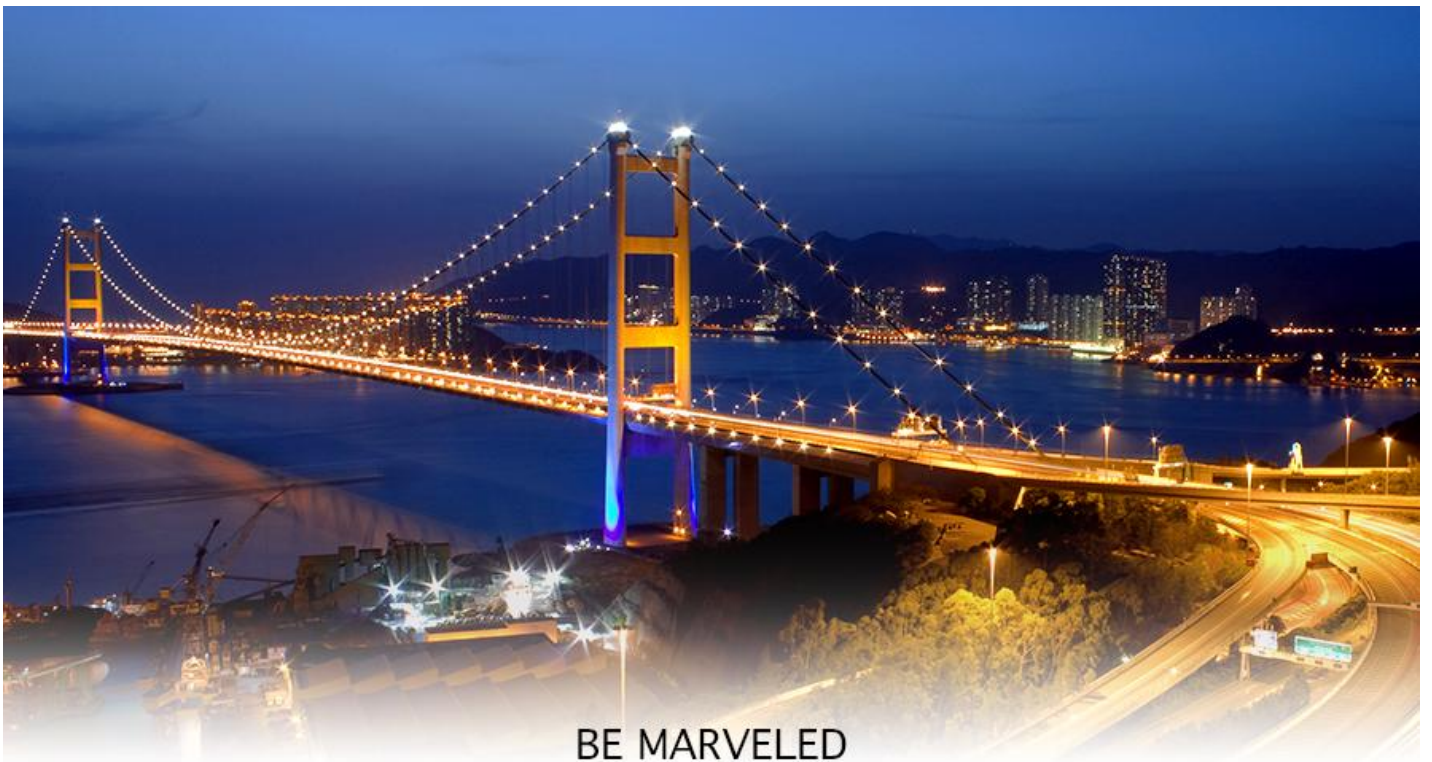
BE MARVELED สะพานแขวนชิงหม่า

17.40 น. เดินทางถึง สนามบินเช็กแล็บก๊อก (CHEK LAP KOK INTERNATIONAL AIRPORT) เขตปกครองพิเศษฮ่องกง หลังผ่านพิธีการตรวจคนเข้าเมืองเป็นที่เรียบร้อยแล้ว รับกระเป๋าสัมภาระ เดินทางโดยรถโค้ชปรับอากาศ (เวลาที่ท้องถิ่นที่ฮ่องกง เร็วกว่าประเทศไทย 1 ชั่วโมง)