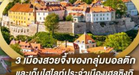
3 เมืองสวยจิ้งของกลุ่มบอลติก และเก็บไฮไลท์ประจำเมืองเอสซิงก์ และล่องเรือเฟอร์รี่ข้ามประเทศ

ไฮไลท์ในโปรแกรม • เที่ยวสามประเทศหลักกลุ่มบอลติก • ชมเมืองหลวงวิลนิอุส ประเทศลิทัวเนีย