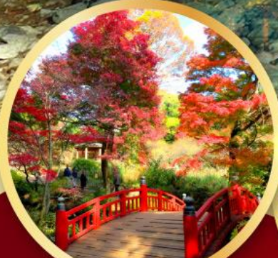
สวนดอกบ๊วยอาคางิ