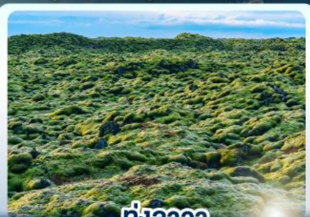
🌿 ทุ่งลาวา