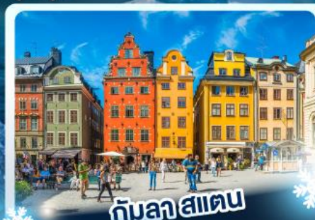
🏘️ กับลาสแตน