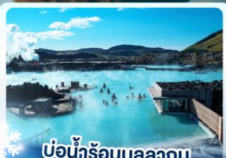
♨️ แช่น้ำร้อนบลูลากูน

เก็บไอซ์แลนด์ แดนภูเขาไฟคีร์กจุฟลา และ แช่น้ำร้อนบลูลากูน