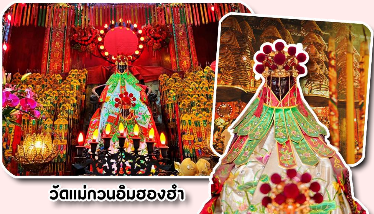
วัดแม่กวนอิมฮ่องกง

พาท่านเดินทางไปไหว้ขอพรขอเงิน วัดแม่กวนอิมฮ่องกง วัดเก่าแก่ของฮ่องกงสร้างตั้งแต่ปี ค.ศ. 1873 เป็นวัดขนาดเล็กที่มีชาวฮ่องกงศรัทธานับถือกันเป็นอย่างมาก วัดแห่งนี้เป็นที่ประดิษฐาน องค์เจ้าแม่กวนอิมฮ่องกง ที่มีชื่อเสียงเรื่องการให้กู้ยืมเงิน เชื่อกันว่าท่านช่วยพลิกฟื้นเศรษฐกิจของชาวฮ่องกง ผู้คนจึงนิยมมายืมเงินทำธุรกิจจนสำเร็จร่ำรวย รุ่งเรือง โดยให้ท่านอธิษฐานขอพรต่อหน้าเจ้าแม่กวนอิมฮ่องกง พร้อมกับระบุวันเวลาในการขอพรด้วย จากนั้นนำธนบัตรตามฐานะและศรัทธาที่เราจะนำเป็นสื่อในการขอพร เขียนจำนวนเงินที่ต้องการลงไปด้วย ใส่สกุลเงินยี่งดีใหญ่ แล้วนำเงินใส่ในซองแดง ควรเตรียมซองแดงไปเอง นำซองแดงไปวนรอบกระถางรูป วนขวาจำนวน 3 ครั้ง แล้วเก็บซองแดงในกระเป๋าสตางค์ เป็นเงินขวัญถุง ถ้าประสบความสำเร็จตามที่มุ่งหวังให้นำเงินในซองแดงทำบุญหยอดตู้ที่วัดแห่งนี้ในโอกาสต่อไป วิธีไหว้ให้ปัง ให้ได้โชคลาภเงินทอง ต้องไปกับเราเท่านั้น