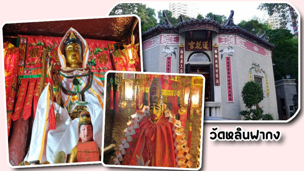
วัดหลินฟาง

พาท่านเดินทางไป วัดหลินฟ้า หรือ วัดดอกบัว เป็นวัดที่อยู่บริเวณหว่านจ่าย ทางทิศตะวันออกเฉียงเหนือของคอสเวย์เบย์ โดยวัดนี้จะถูกก่อสร้างในช่วงราชวงศ์ชิงหรือ ปี ค.ศ. 1963 มีการบูรณะอีกครั้งในปี ค.ศ 1986 และ 1999 มีเจ้าแม่กวนอิมเป็นองค์ประธานของวัด โดยมีตำนานเล่าว่า เจ้าแม่กวนอิมเคยมาปรากฏตัวที่วัดแห่งนี้ ชาวบ้านจึงเลื่อมใสศรัทธา จนรวมใจกันสร้างวิหารดอกบัวและประดับด้วยโคมดอกบัวต่างๆ เพื่อเป็นการบูชาและสักการะ นอกจากนี้ทางวัดหลินฟ้าก็ยังมี เทพเจ้าสาวจื่อเฮียะ หรือเทพเจ้าสายนรก เป็นเทพเจ้าที่ขึ้นชื่อเรื่องกตัญญูที่มาในรูปลักษณะการนุ่งห่ม ผ้าดิบ ซึ่งเป็นสัญลักษณ์ของการไว้ทุกข์ที่คนเชื่อสายจีนให้ความสำคัญ เทพเจ้าองค์นี้ ก็เปี่ยมไปด้วยพลังหยิน ซึ่งเป็นด้านเกี่ยวกับเงินเงินทองทอง สำหรับผู้ที่ชอบเสี่ยงโชค