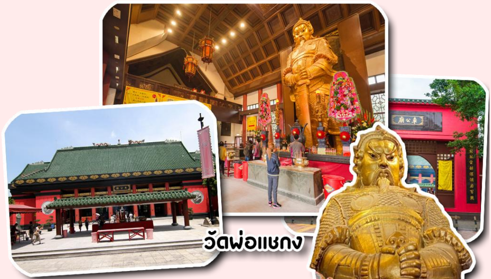
วัดพ่อแชกง