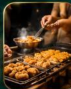
สตรีทฟู้ดชื่อดัง