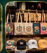
ของฝากเก๋ ๆ