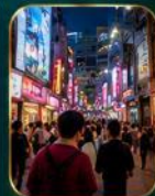
แหล่งช้อปปิ้งแฟชั่นสุดชิค