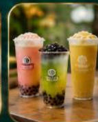
เครื่องดื่มยอดนิยม