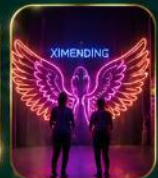
จุดเช็คอินสุดฮิต