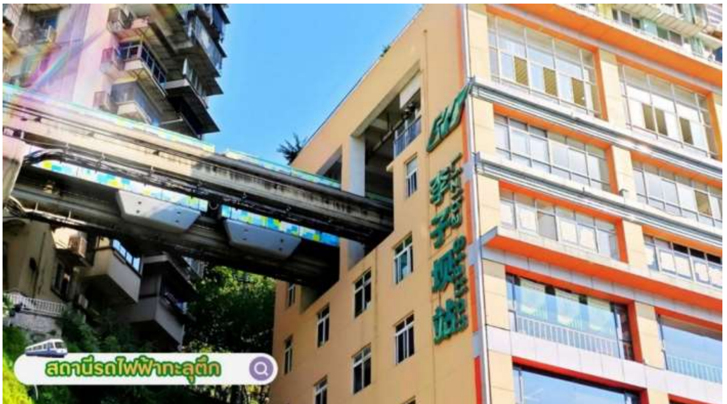
สถานีรถไฟฟ้าทะเลตุ๊ก

นำท่านสู่ มหาศาลาประชาคมฉงชิ่ง (Chongqing Great Hall of the People) **ชมด้านนอก** คือสัญลักษณ์สำคัญของเมืองฉงชิ่ง เป็นอาคารขนาดใหญ่ที่มีสถาปัตยกรรมจีนอันงดงาม ผสมผสานศิลปะแบบราชวงศ์หมิงและชิง โดยได้รับแรงบันดาลใจจากหอฟ้าเทียนถาน (Temple of Heaven) ในปักกิ่ง ภายในจุคนได้กว่า 4,000 คน ใช้เป็นที่ประชุมสภาผู้แทนราษฎรและโรงละคร มีความโดดเด่นที่โดมกลางขนาดใหญ่สีแดง-เขียว ตั้งอยู่ใกล้กับจัตุรัสประชาชน และเป็นจุดหมายยอดนิยมที่นักท่องเที่ยวต้องไปเยือนเพื่อชมสถาปัตยกรรมและบรรยากาศเมือง