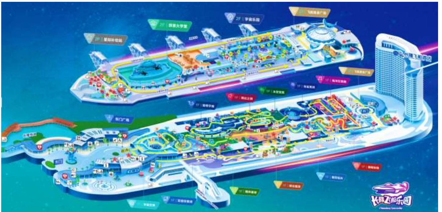
แผนที่ CHIMELONG SPACESHIP PARK