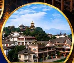
เมืองโบราณเฉิงชิว