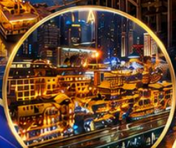
หงหยาดิ่ง