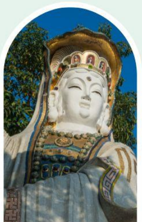
เจ้าแม่กวนอิม ธิพลสัย