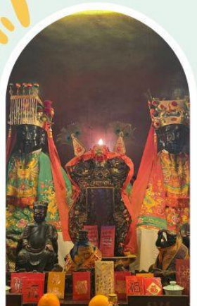
วัดหมิ่นโหมว