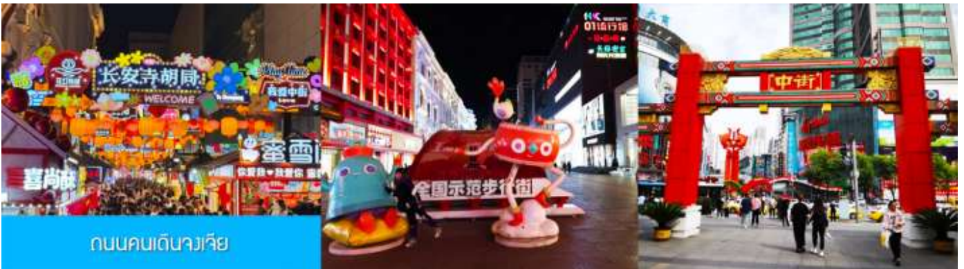
ถนนคนเดินวางเวีย