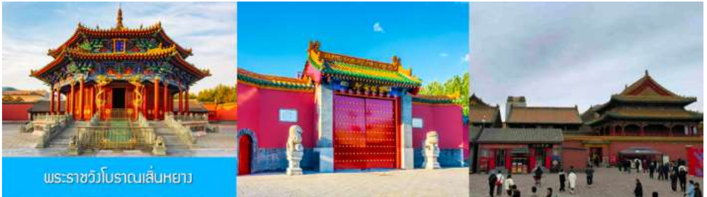
พระราชวังโบราณเสียนหยาง

รับประทานอาหารเช้า ณ ห้องอาหารของโรงแรม (1)