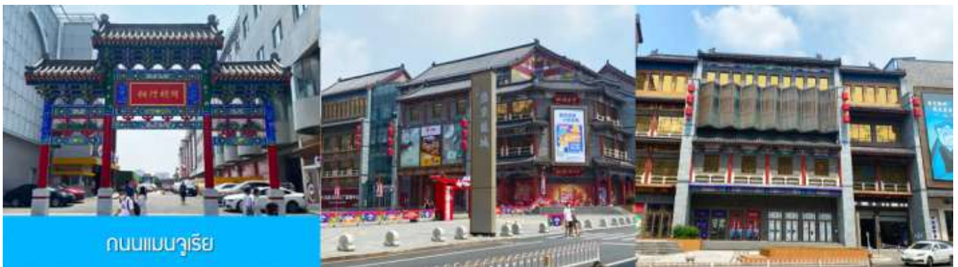
ถนนแมนจูเรีย