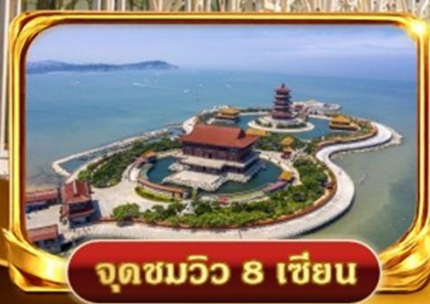
จุดชมวิว 8 เซียน