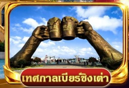
เทศกาลเบียร์ชิงเต่า