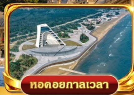
หอดอยกาลเวลา