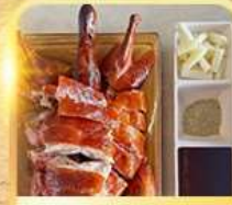
เปิดปาทัง