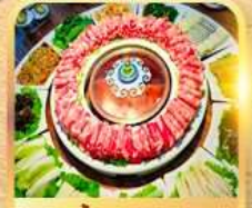
สุกีสไตล์มองโก