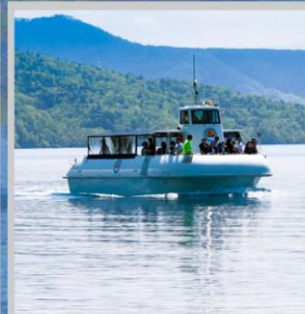
“LAKE SHIKOTSU GLASS BOAT”