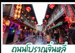
ถนนโบราณจินหลี่