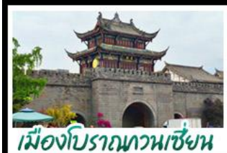
เมืองโบราณทวนเซี่ยน

ภูเขาสี่ดรุณี - อุทยานปี้เฉิงโกว - สะพานหนานเฉียว - ร้านหนังสือจงซูเก๋ - เมืองโบราณกวนเสียน จตุรัสหยางเทียนหวู่ - หมู่บ้านต้าซาฟี่ - ถนนโบราณซอยกว้างซอยแคบ - ถนนคนเดินไท่กู๋หลี่ ถนนคนเดินซุนซี - ถนนโบราณจินหลี่ - พิพิธภัณฑ์ปักกิ่ง - น้ำพุไม้ไผ่ตึกSKP - วัดต้าฉือ