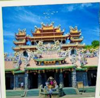
วัดกวนตุ๋