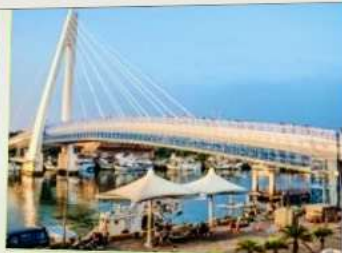
สะพานคู่รักต๋ั้นสุ่ย