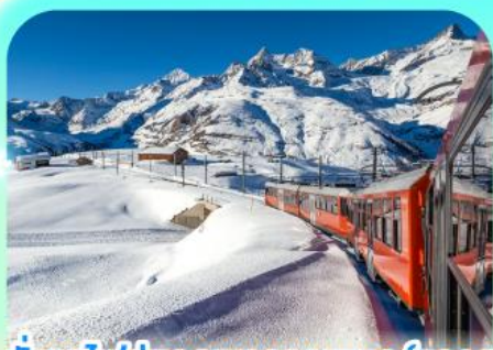
นั่งรถไฟสู่ยอดเขารอนเนอร์เกรต

สวยสะท้านฟ้าที่สวิสฯ สะกิดรักที่โดมโบ พิชิตเขาแมทเทอร์ฮอร์นและจุงเฟรา