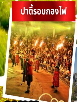
ปาร์ตี้รอบกองไฟ