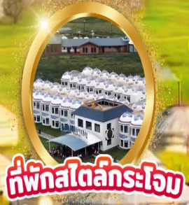
ที่พักสไตล์กระโจม