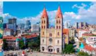
โบสถ์คริสต์เซนต์ไมเคิล

*ทางบริษัทฯ ขอสงวนสิทธิ์ในการสลับโปรแกรมทัวร์ตามความเหมาะสมขึ้นอยู่กับสถานการณ์หน้างาน โดยคำนึงถึงผลประโยชน์ของลูกค้าเป็นสำคัญ