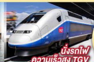
นั่งรถไฟ ความเร็วสูง TGV