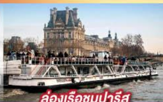
ล่องเรือชมปารีส