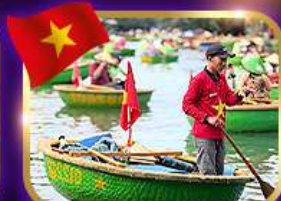
เรือกระด้ง หมู่บ้านกิมกาน