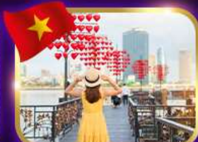
เช็คอินสะพานแห่งความรัก