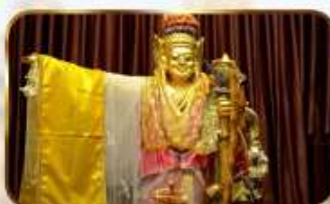
เทพทันใจโจ้เข้า