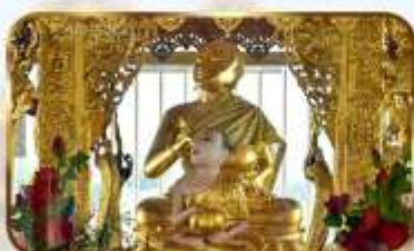
ขอพระพระอุปลุด ปางจกบาตริเยียมาร