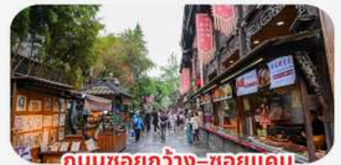
ถนนชอยกว้าง-ชอยแคบ