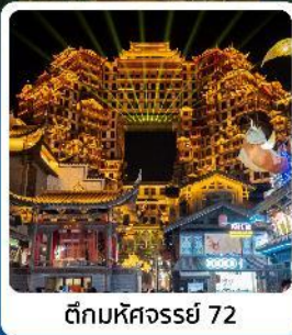
ตึกหอคจรรย 72