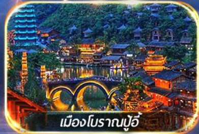
เมืองโบราณปู้จี้

สัมผัสบรรยากาศสุดโรแมนติก ณ หมู่บ้านปู้จี้ & ป่ากุเขามันหยอด เดินเล่น Wenlin Street ชมต้นแปะก๊วย & ถนนสายคาเฟ่สุดฮิต