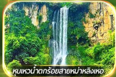
หุบเขาน้ำตกร้อยสายหม่าหลิงเหอ

ชมป่าภูเขาหมื่นยอด, เที่ยวหมู่บ้านโบราณหลินปู้อี ล่องเรือทะเลสาบว่างเฟิงหู, ชมสวนดอกไม้ตามฤดูกาล