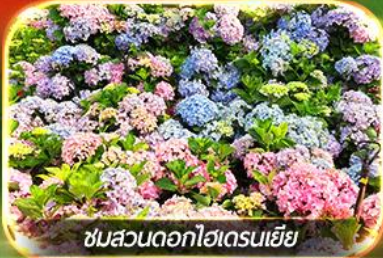
ชมสวนดอกไฮเดรนเยีย