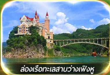
ล่องเรือทะเลสาบว่างเฟิงหู