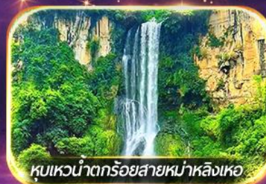
หุบเขาน้ำตกร้อยสายหม่าหลิงเหอ

ชมวิถีชีวิตหมู่บ้านปู้อี้ยามค่ำคืน, ล่องเรือทะเลสาบว่างเฟิงหู ชมสวนดอกไม้ตามฤดูกาล, ซอปปิ้งจูงใจถนนคนเดิน