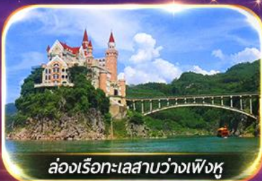
ล่องเรือทะเลสาบว่างเฟิงหู