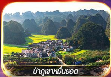
ป่าภูเขาหมื่นยอด