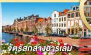
จัตุรัสกลางฮาร์เลม