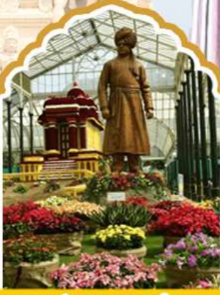
บังกาลอร์