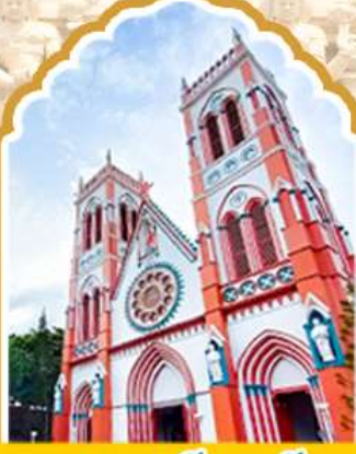
ปอนตีเซอรั