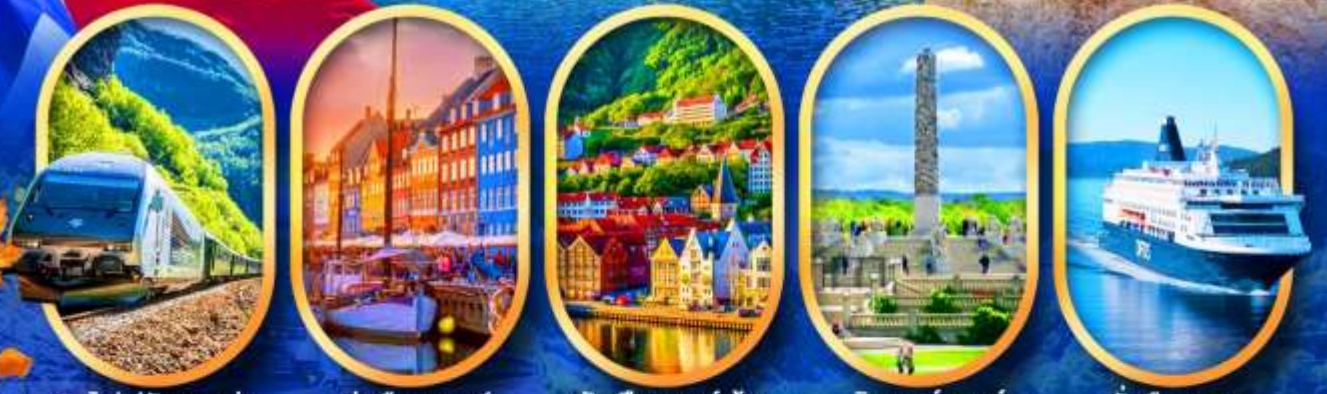
รถไฟฟลิมสบาน่า ท่าเรือฮาวน์ พักเมืองเบอร์เก็น วิกเกอร์แลนด์ นั่งเรือ DFDS