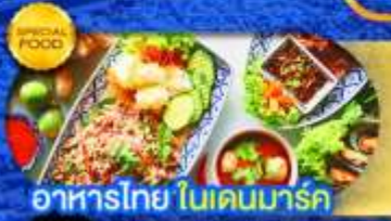
อาหารไทย ในเดนมาร์ก