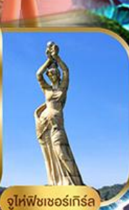
จูไห่ฟิชเชอร์เก็ส