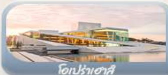
โอปราเฮาส์

11-19 มิ.ย. 69 / 23-31 ก.ค. 69 / 05-13 ส.ค. 69 03-11 ก.ย. 69 / 24 ก.ย.-02 ต.ค.69