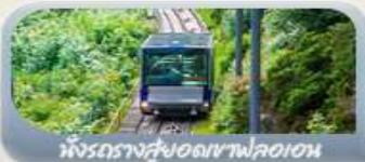
ฟังกรางสูงอดเขาฟลอมอน