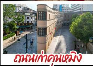
ถนนเก่าคุณหมิง