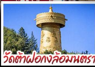
วัดต้าฝอ กงล้อมณฑล