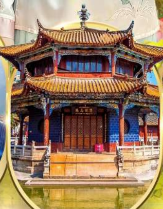
วัดหยวนถง