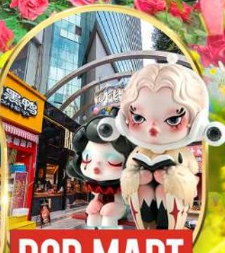
POP MART ถนนคนเดินหนานผิงเจีย