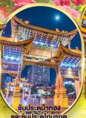
ซุ้มประตูม้าทอง และ ซุ้มประตูโก๋มรกต