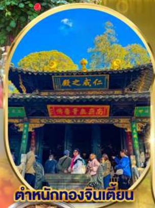
ตำหนักทองจินเตียน